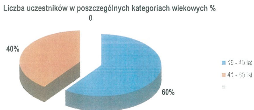
Wykres 1 Liczba uczestników w poszczególnych kategoriach wiekowych WTZ w Gubinie